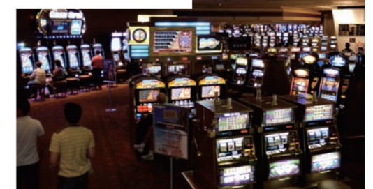
※上記イメージ写真