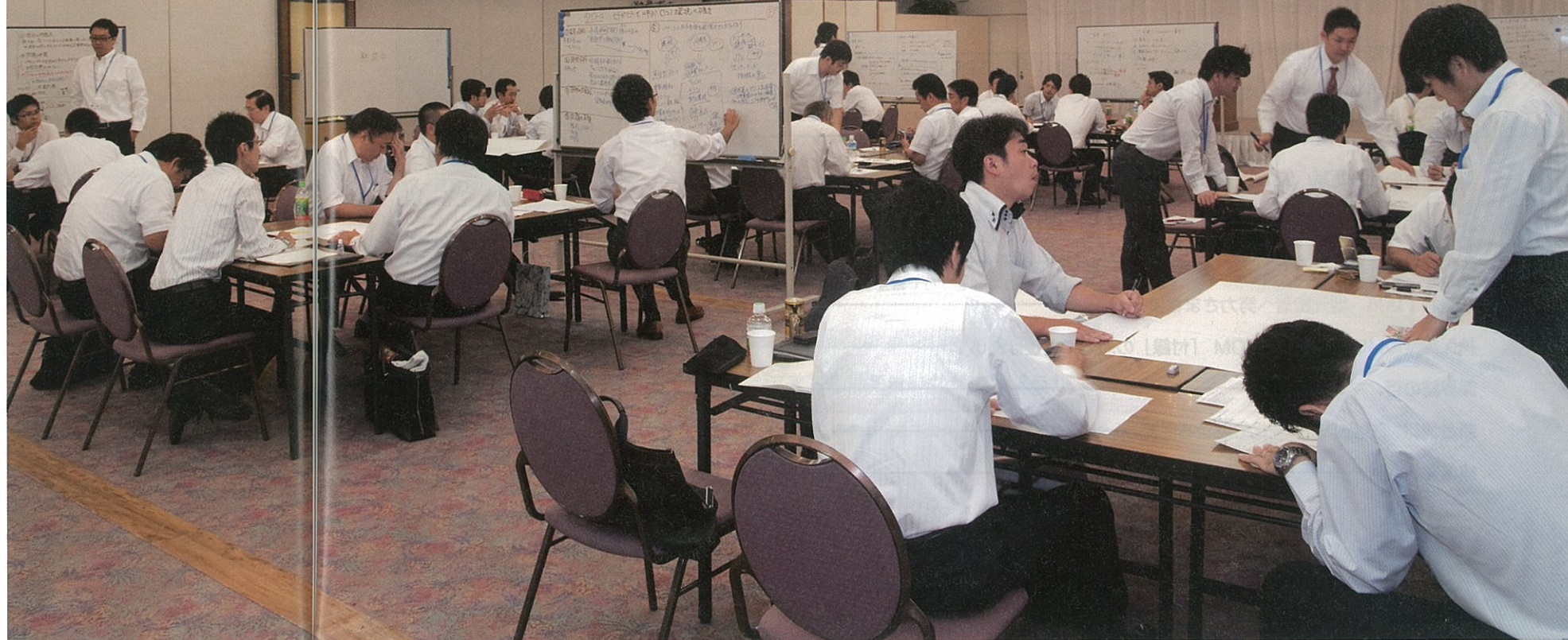
各チームともボードを使い整理しながら討議を深めた

懇親パーティーなどで構成された。3日目は同県嵐山町花見台地区の「共生の森」で下草刈りなどの社会貢献活動に汗を流した。 11班に分かれて 粘り強く深夜まで 【第1日】 午後1時、開校式が行われ、知念安光・明日の産業創造室長（日遊協理事）が「パチンコ産業はいろいろな問題を抱えている。同じ業を営む者として腹いっぴい本音で語り合って、将来につなげていく話をしてほしい。そして何よりも人脈を広げて、横のつながりをいっぴいつくって帰ってください」とあいさつした。 グループワークは11班（1班5〜6人）に分かれて行われた。基調テーマに沿って、①本当の意味での顧客視点とは ②既存顧客視点と新規顧客（フューチャー）視点 ③ホールのサービスは過剰か？