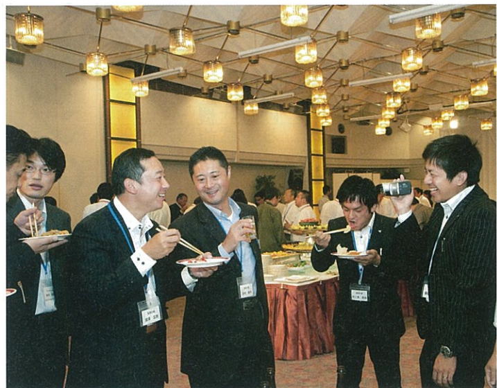
懇親会ではグループ討議の疲れも忘れ談笑の輪ができた