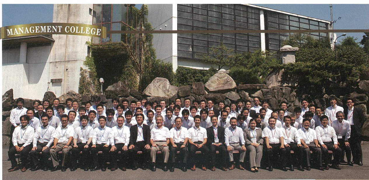
残暑の厳しさにも負けず参加者全員が集合して