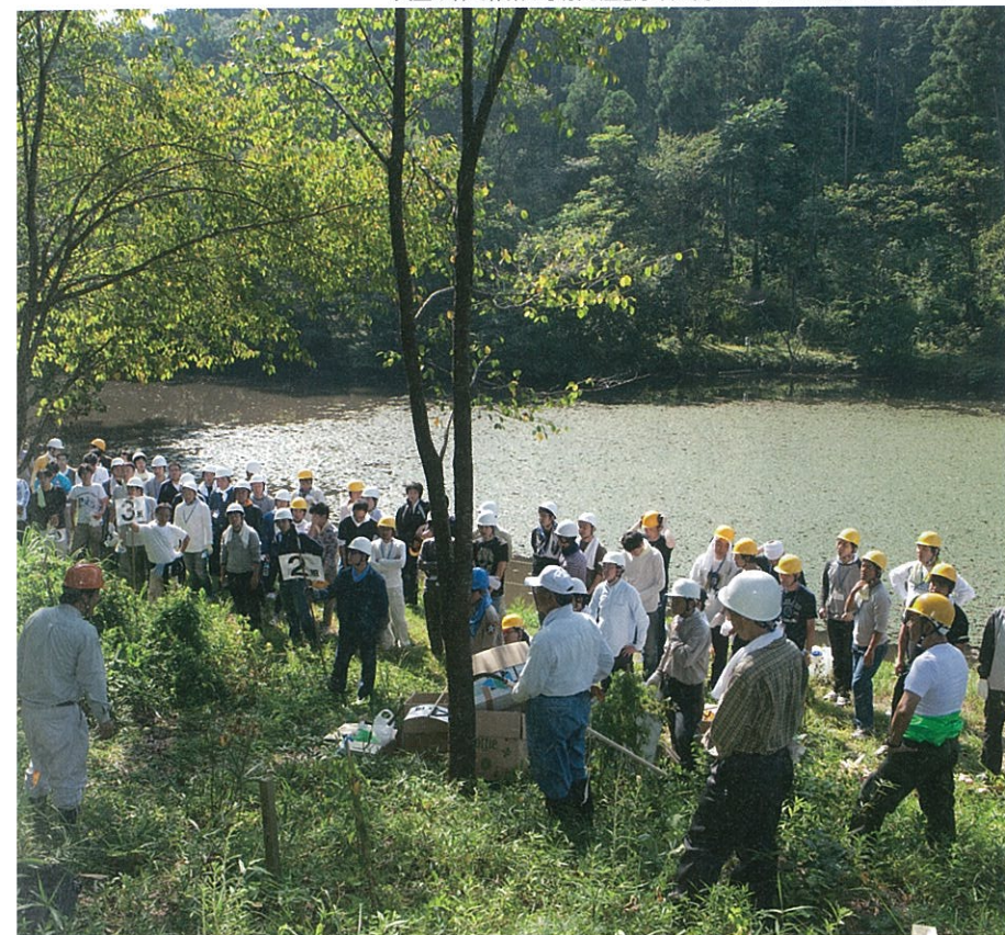
共生の森で作業の手順と注意事項を聞くマネカレ参加メンバーたち