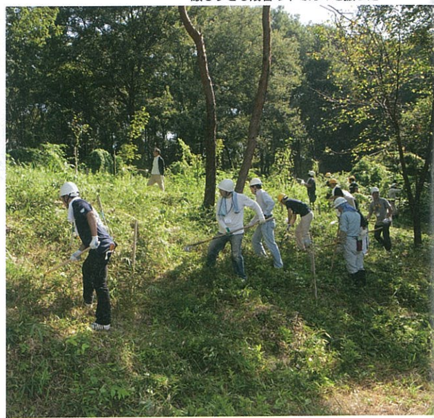
厳しすぎる残暑の中でカマを振った