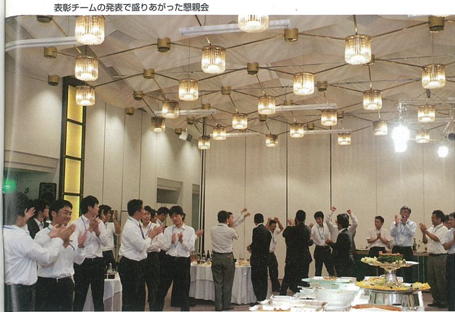
表彰チームの発表で盛りあがった懇親会

から考えてみた。サービスについてのお客様のニーズは多種多様だが、ホールのサービスはマニュアルによる画一化がなされている上、効率優先で、言い換えれば店の都合でルールが作られている。また、遊技メーカーの製品は、お客様視点に立っているとはいえない。つまり、お客様のニーズと提供するサービスとが一致していない。