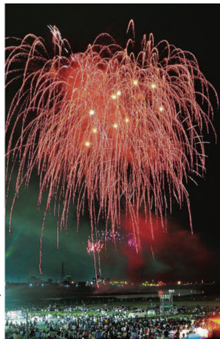
鳥取の夏を彩る第58回市民納涼花火大会 =2011年8月17日