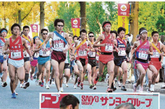
▼サンヨーグループの特別協賛で開かれる米子-鳥取間駅伝 =2011年11月13日 日本海新聞掲載

別協賛企業」となっています。直近の「第66回」大会は、2011年11月12、13の2日間、870人、